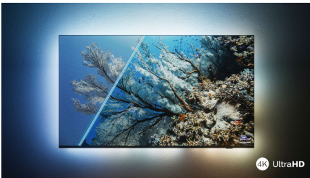
Imagen HDR vibrante

¿Quieres disfrutar de una imagen perfecta en cada escena? El televisor 4K UHD de Philips es compatible con los principales formatos HDR, lo que significa que verás imágenes brillantes y nítidas. Verás cada detalle, incluso en las zonas oscuras y brillantes.