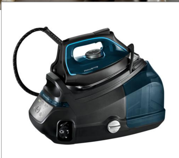
SILENCE STEAM PRO 7,6 BARES Centro de planchado de alta presión DG9161F0